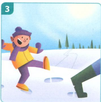
in de voetsporen treden van