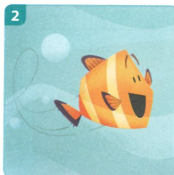
je als een vis in het water voelen