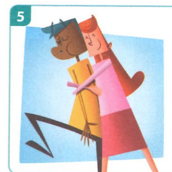
iemand in zijn greep hebben

betekenis: ervoor zorgen dat iemand doet