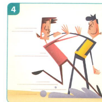
ergens een stokje voor steken