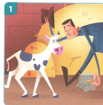
iemand geen strobreed in de weg leggen

betekenis: niets doen om iemand tegen te