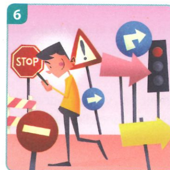
de verkeerde kant opgaan